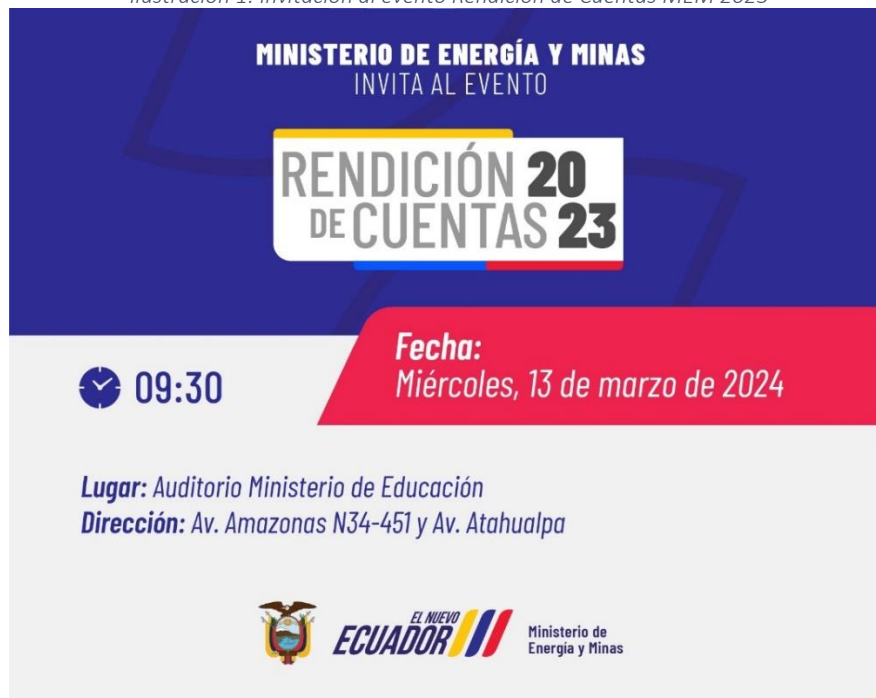
Ilustración 1: Invitación al evento Rendición de Cuentas MEM 2023